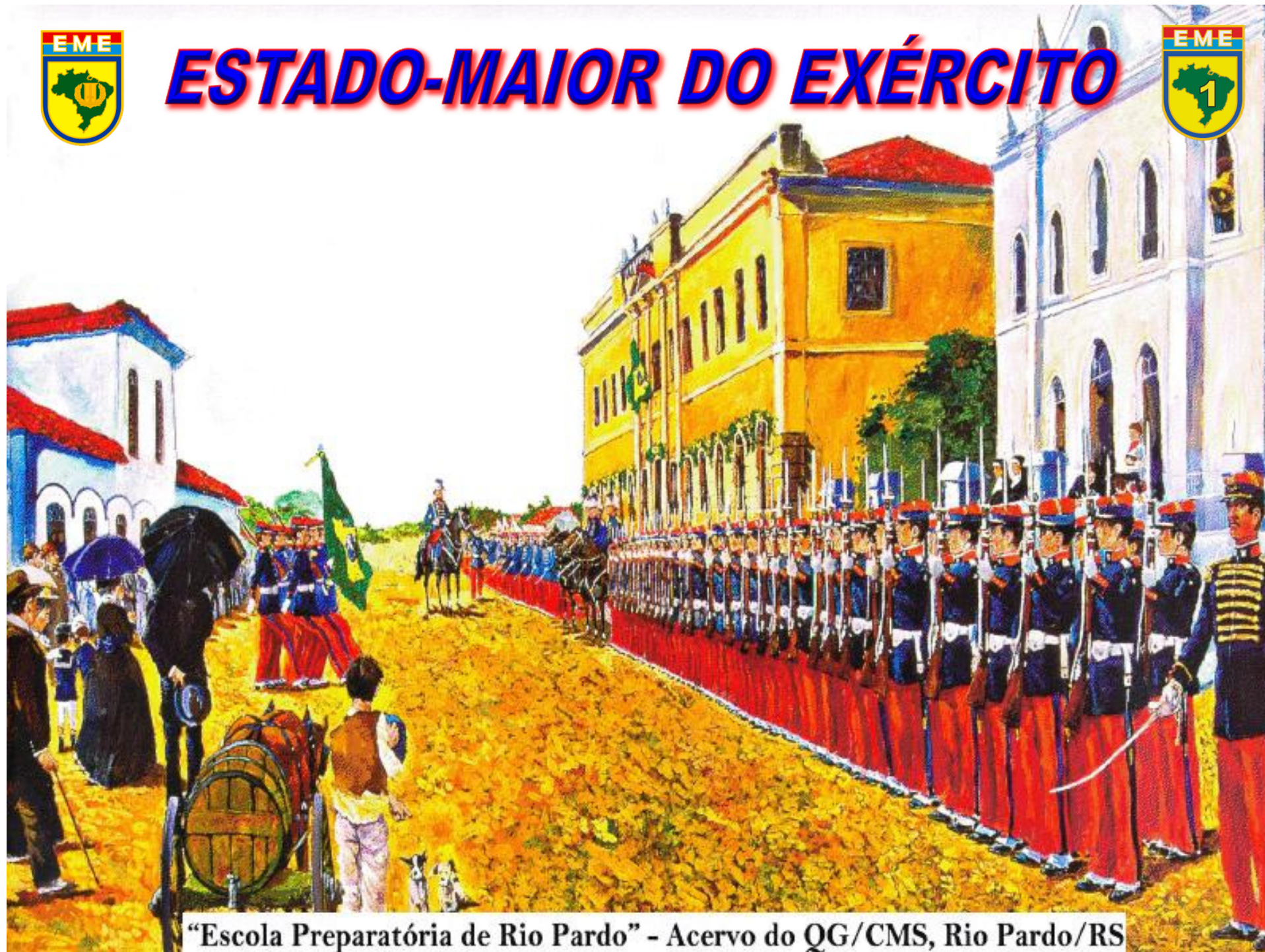
“Escola Preparatória de Rio Pardo”